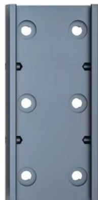
Vodiaca lišta Doska plošných spojov