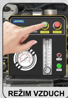
Nezávisle ovládané vstavané vzduchové čerpadlo