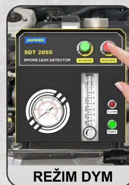
Nezávisle ovládaný generátor dymu