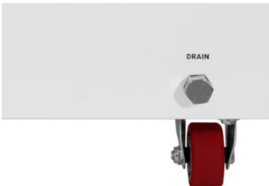
Kolesá na premiestňovanie a drenáž